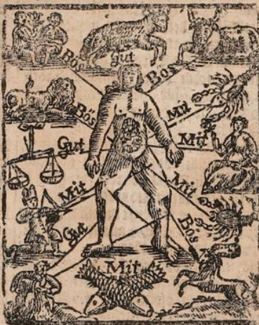
Fische die Füße gut.

Löw das herzh, magen und rüct, darinnen ist böß lassen.