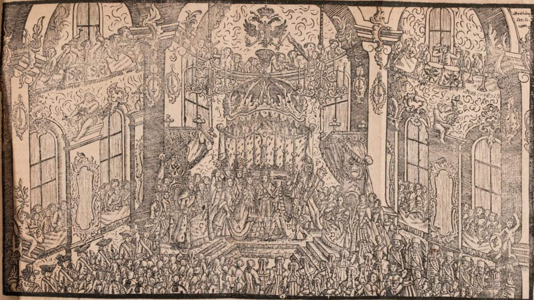
Werbung des Kupfers: A) Ihre Durchl. die Erzherzogin Carolina als Königl. Braut. B) Sr. Königl. Hohheit der Erzherzog Ferdinand. C) D) Ihre K. K. Majestäten mit den samtl. Durchl. Herrschaften. E) Der päbstl. Herr Nuntius, durch welchen die eheliche Einsegnung geschah. F) Die übrige Hof- und andere hohe Geistlichkeit.