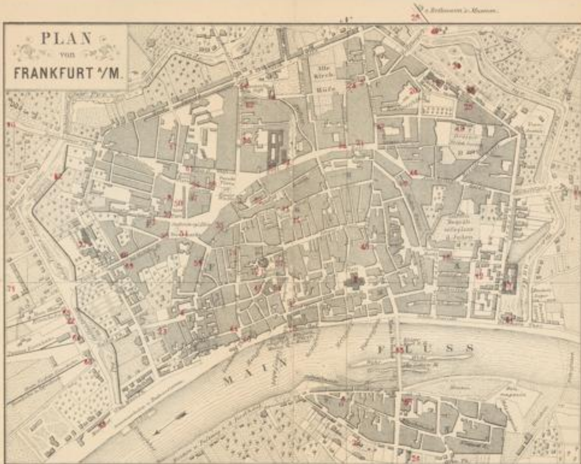
54. Der Römer, Sitzungs-Local.